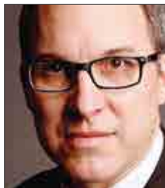
L'honorable Stéphane Davignon Observateur (depuis le 1 er mars 2019)