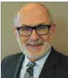
L'honorable Pierre E. Audet Observateur (jusqu'au 28 février 2019)